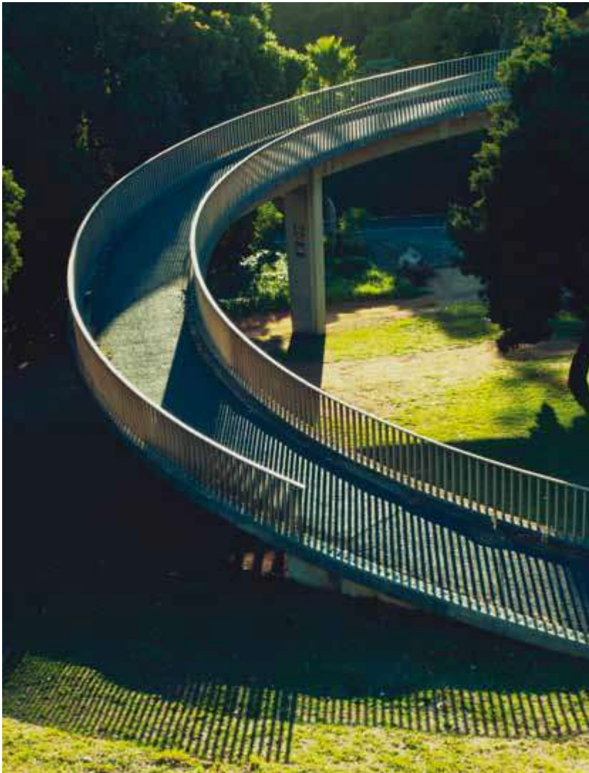
Puente peatonal en Cape Town Suráfrica

Las zonas urbanas continúan expandiéndose a través de interminables periferias, con graves y generalizados problemas de congestión del tráfico, dependencia de los vehículos de motor y uso intensivo de combustibles fósiles caros.